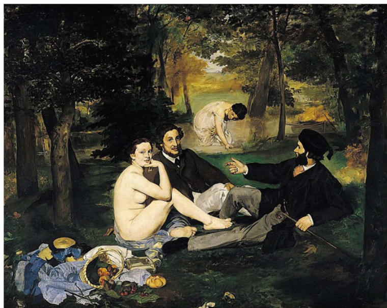
Édouard Manet, El dinar campestre , 1863