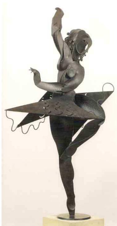
2. Pablo Gargallo, Gran ballarina , 1929