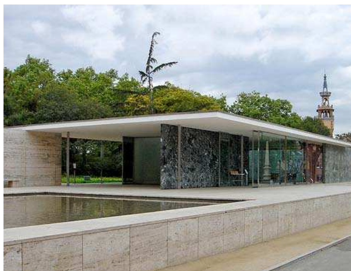
Mies van de Rohe, Pavelló alemany de l'Exposició de Barcelona , 1929

B. L'expressionisme alemany com a exemple d'interrelació entre la pintura i el cinema: El gabinet del doctor Caligari , de Robert Wiene, 1919. Característiques de l'expressionisme alemany com a moviment i de la pel·lícula com a exemple de col·laboració dels (pintors i arquitectes) plàstics al cinema.