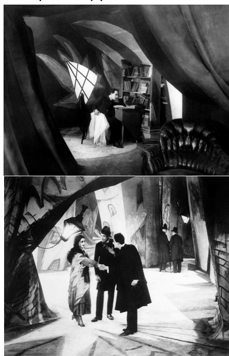
El gabinet del doctor Caligari , de Robert Wiene, 1919

B. L'expressionisme alemany com a exemple d'interrelació entre la pintura i el cinema: El gabinet del doctor Caligari , de Robert Wiene, 1919. Característiques de l'expressionisme alemany com a moviment i de la pel·lícula com a exemple de col·laboració dels (pintors i arquitectes) plàstics al cinema.