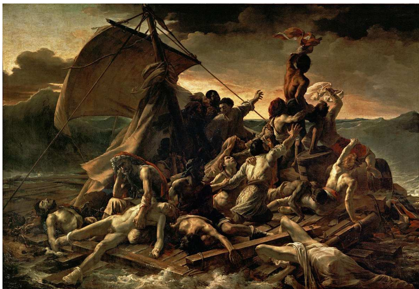
1. Theodore Géricault, El rai de la Medusa , 1819