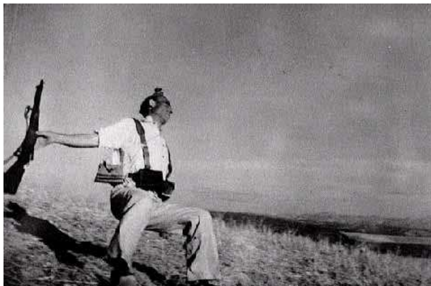
Robert Capa, Mort d'un milicià , 1936